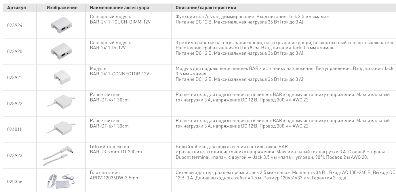
ТАБЛИЦА ДОПОЛНИТЕЛЬНЫХ АКСЕССУАРОВ